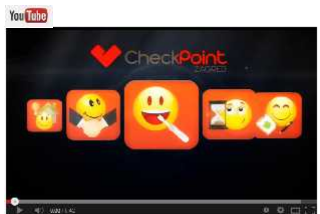
CheckPoint video spot

https://www.youtube.com/watch?v=gFsiXhB_DYM