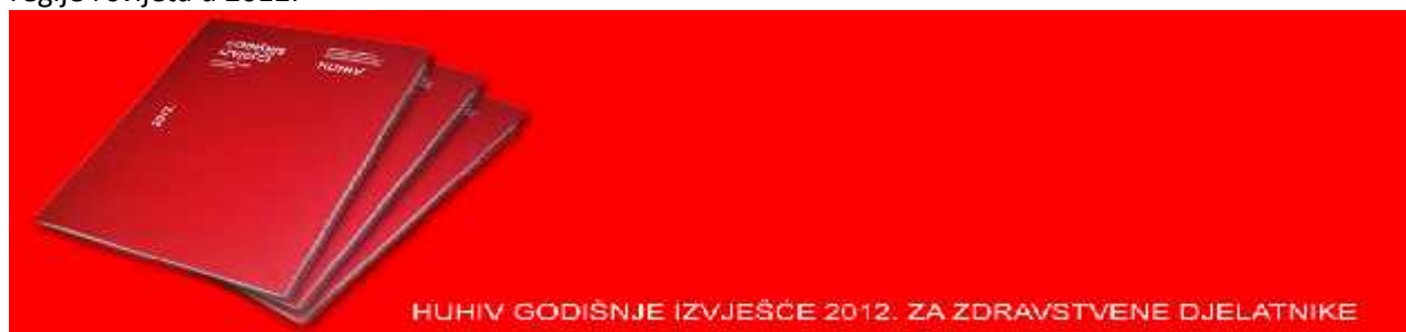
HUHIV GODIŠNJE IZVJEŠĆE 2012. ZA ZDRAVSTVENE DJELATNIKE

13. godinu za redom HUHIV je ponosno izdao HUHIV bilten / godišnjak za 2012. godinu. HUHIV godišnjak tradicionalno je kreiran za zdravstvene djelatnike i donosi bogat pregled stručnih članaka, novosti i događanja u području HIV-a, hepatitisa i ostalih spolno prenosivih bolesti, kvalitete života i liječenja, pregled evenata, projekata i aktivnosti Udruge HUHIV, sudjelovanja, postignuća te novosti i istraživanja iz regije i svijeta u 2012.